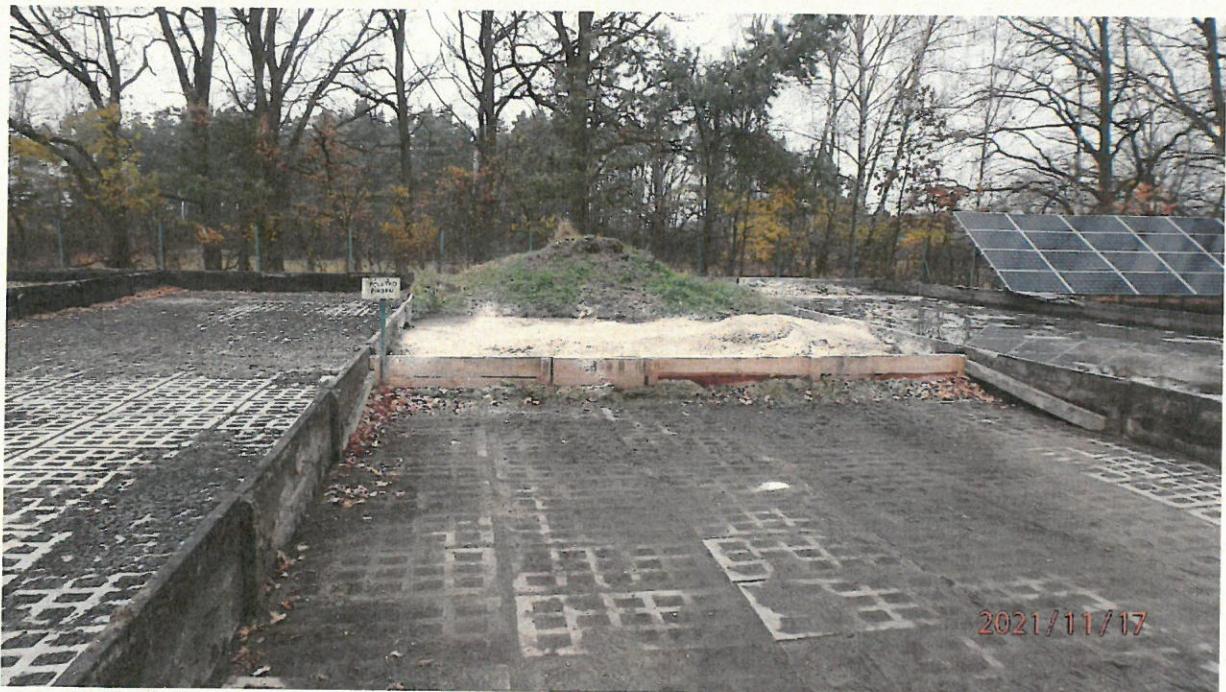
Ryc. 2 Kontrola Zakładu Usług Komunalnych Tworóg Sp. z o.o. ul. Zamkowa 16 42-690 obiekt: oczyszczalnia ścieków w Tworogu, widok na magazynowane odpady o kodzie 19 08 02 (zawartość piaskowników) na poletku znajdującym się na terenie oczyszczalni ścieków w Tworogu