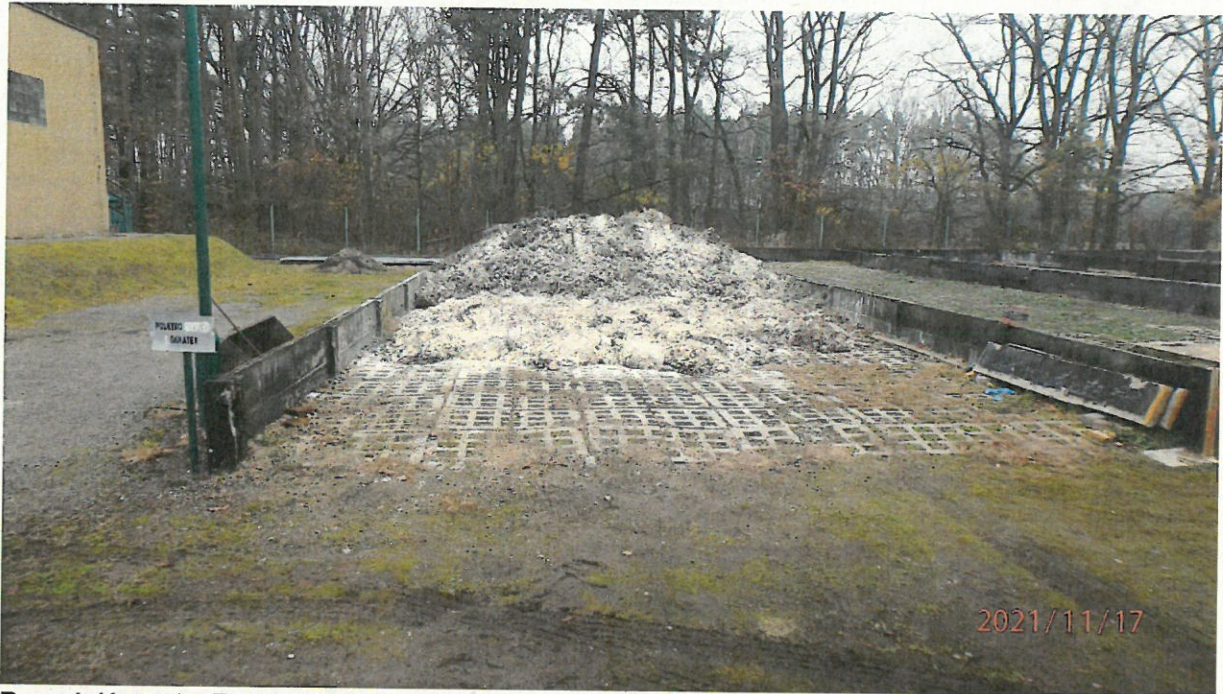
Ryc. 1 Kontrola Zakładu Usług Komunalnych Tworóg Sp. z o.o. ul. Zamkowa 16 42-690 obiekt: oczyszczalnia ścieków w Tworogu, widok na magazynowane odpady o kodzie 19 08 01 (skratki) na poletku znajdującym się na terenie oczyszczalni ścieków w Tworogu